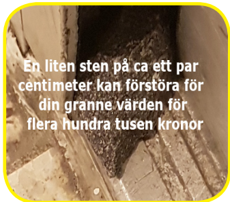
En liten sten på ca ett par centimeter kan förstöra för din granne värden för flera hundra tusen kronor

På senare tid har vi haft flera inbrott och inbrottsförsök i våra lägenheter. Det är svårt att skydda sig helt och hållet. Vi kan hjälpas åt att inte någon obehörig kommer in i våra hus. Det kan man göra på många olika sätt. Om det står människor utanför porten som man inte känner igen, kan man fråga dom vart dom ska. Ett annat sätt är att inte lägga stenar i porten för att vänner och barn ska komma in. Det finns nycklar hos HSB som man kan köpa som bara man kan öppna entréerna/portarna. Alla fönster